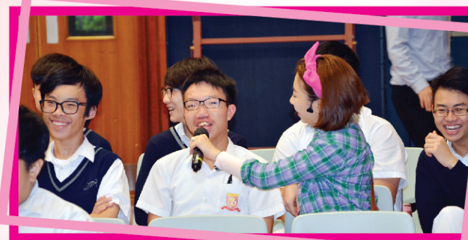
▲ 同學面對表演者以普通話即席考問亦毫不怯場！

在這次語文周中，我除了擔任語文周開幕與閉幕的司儀外，亦主動參與了不少語文活動，其中令我印象最深刻的是普通話攤位遊戲，因為當我在排隊等待玩遊戲時，我留意到不少同學專注地思考問題的答案，並自信地用普通話作答，有些同學獲獎時更喜形於色，這些景象令我真正感受到甚麼是「寓學習於娛樂」！我們既能從遊戲中得到快樂，又能學到不少普通話語音知識，真是一舉兩得呢！