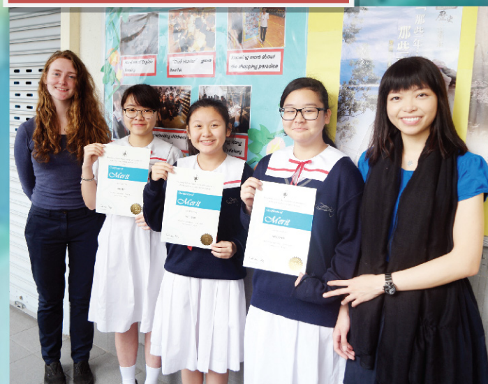
(Left) F.4 Girls Solo Verse Speaking 2 nd Runner-up