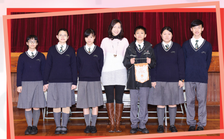
六位參賽同學與指導老師合照。

今年我參加了第六十七屆香港學校朗誦節普通話的朗誦比賽，很榮幸取得了冠軍。首先我非常感謝學校給予我栽培，讓我的付出得到大家的肯定。猶記得當初得到老師的指導和提點後，我回家不斷努力地練習，一點一點地進步。當中老師的肯定哪怕是一點點，也會讓我更加有信心、有動力地繼續努力下去。這次獲獎，讓我更加明白不管做什麼事，只要不斷努力和堅持，就一定能成功，就像「世上無難事，只怕有心人」這句名言一樣。在這我非常感謝老師對我辛勤的教導，讓我學會畢生受用的技巧，也讓我在中學生活中增添這麼精彩的經歷。