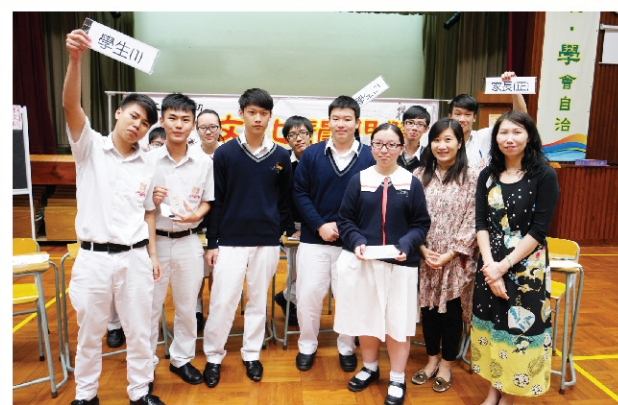
▲ 學生主持對自己的表現相當滿意，來一張大合照吧！