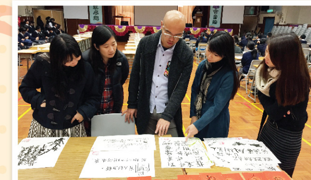
▲ 幾位評判老師正在交換意見，評選優勝作品。