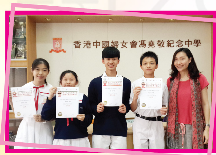
▲ 參賽同學與顧問老師合照。