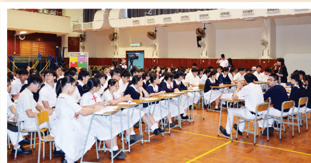
▲ 全場座無虛席，同學齊來參與中文科午間活動。

本年度繼往開來，以優化主持人的討論內容為目標；同時，每次活動除設有兩名「台下最佳發言獎」外，亦繼續舉行「星級主持」選舉，由出席同學以一人一票形式選出，藉此提升主持人的論說水平，亦鼓勵到場同學積極投入活動，令活動氣氛更形熾熱。