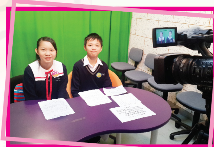
▲ 兩位中一小主持表現從容。

要提升學生的普通話水平，除了課堂教育，還必須營造優良的語言學習環境。因此，每逢星期二早會時段，我校都會以普通話進行廣播。廣播大使會以普通話就不同的主題作分享，例如有趣影片、歌曲播放及溫馨故事等。今年繼續由學生主持整個普通話早會節目，讓學生有更多自主的機會，發揮更大潛能。此外，本年度繼續有普通話午間攤位遊戲的簡介環節，當中除了介紹遊戲規則，也會預演部分題目，務求吸引同學到場玩樂之餘，也練習到普通話語音知識，讓他們能在日常生活中潛移默化，從而提升他們運用普通話的能力。