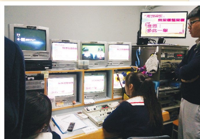
▲「校園電視廣播」正在進行早會廣播。

中文科「校園電視廣播」利用校園電視台作為平台，以深入淺出的方式為同學介紹不同的中文「冷知識」。節目以有趣生動的內容為主題，期望透過多元化的語文節目，介紹中文知識，從而推動學生主動學習語文。每次節目均由學生擔任主持，藉此提升學生的演說能力。