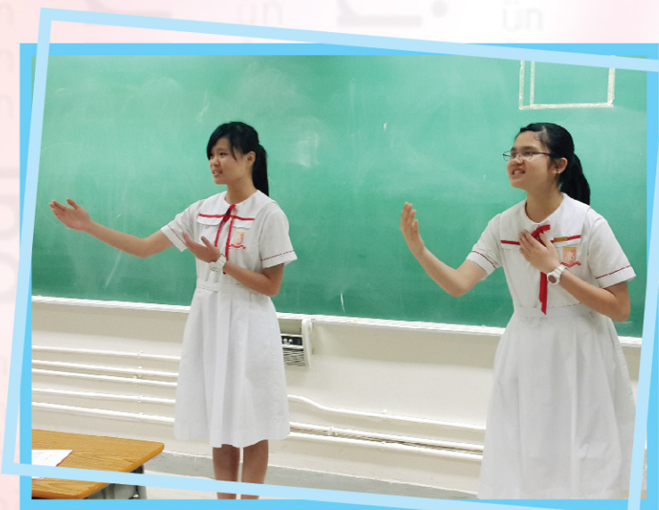
參賽同學投入地演繹誦材。

自從入讀本校以來，我就很喜歡挑戰各種普通話活動與比賽，我很感恩自己擁有普通話的優勢，讓我可以接觸不同的校內語文活動與校外公開比賽。而當中叫我印象最深刻的，就是校際朗誦比賽。今年，我非常榮幸獲得了中三、四級男子詩詞獨誦亞軍，這可是我第一次得獎呢！還記得在比賽前一天，我還在不斷反覆練習，不但把誦材倒背如流，還深入鑽研如何能使感情表達得更好。這一次的比賽經驗真是相當的寶貴，真希望來年也可以繼續參與其中，而且成績更上一層樓！