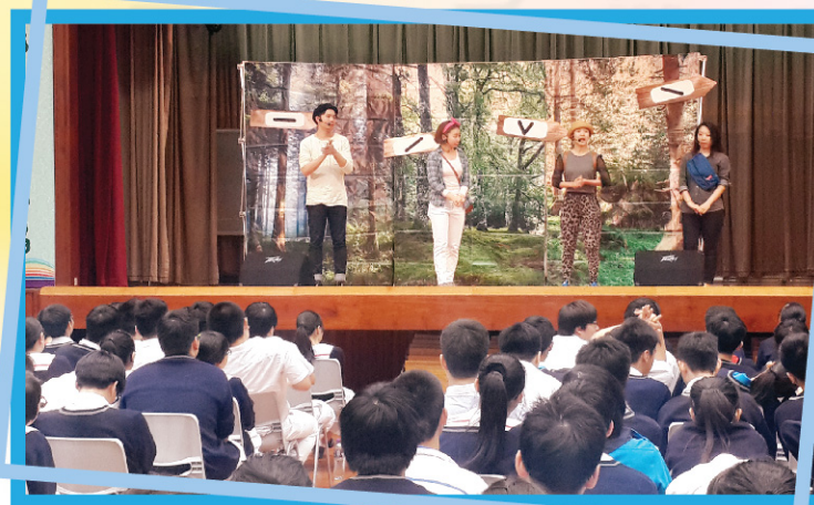
▲ 同學們正聚精會神地欣賞普通話短劇。

本年度語文周的主題是「語文續FUN樂」，期望同學透過參與一連串精彩的活動，體會到學習普通話樂趣無限。首先，普通話科在星期二的午息時段，設有「趣味普通話」攤位遊戲，遊戲主題圍繞有趣的題目，同學可以在遊戲中領悟普通話的趣味，更可以從中練習普通話語音知識。此外，在普通話早會中，主持人示範了多首普通話的繞口令，並配合短片講解，趣味盎然；而在各級的週會上，同學也能運用兩文三語，例如中三、中四級的周會，就邀請到「遊劇場」來校作互動劇場，劇中運用普通話的四個聲調，帶同學經歷一次不普通的旅程。