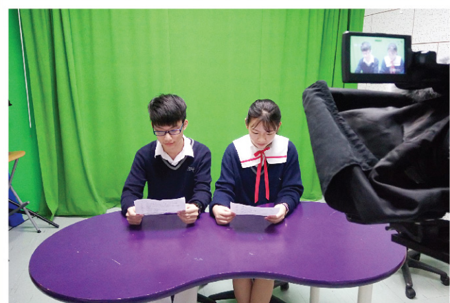
▲ 學生主持準備向同學介紹不同的中文「冷知識」。