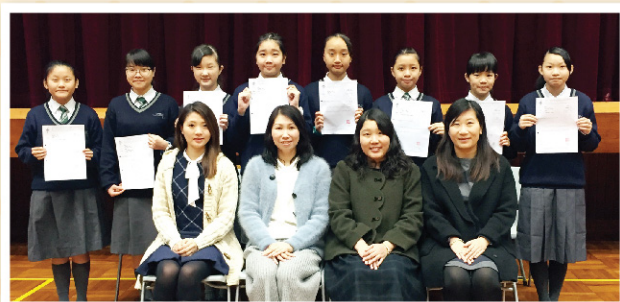
▲ 本年度優勝者與老師合照。

中文科每年都會安排學生參與校際朗誦比賽，今年繼續聘請導師為學生提供更專業的指導。透過訓練和比賽，除了能提升學生朗誦技巧，還能培養學生欣賞文學作品的興趣及提升鑒賞能力。本年度有八位來自各級的同學參與其中，全部同學的成績亦達優良及以上，其中三位同學更脫穎而出，摘下一亞兩季的佳績。