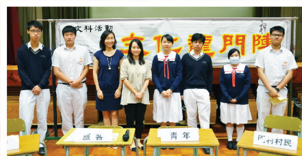
▲ 活動後，主持跟老師合照留念。

最後，我非常感謝老師給予機會，讓我成為其中一位主持。如果再有機會，我希望可以再次參加這個活動，而且經過今次的經驗，我相信自己可以有更佳的表現。