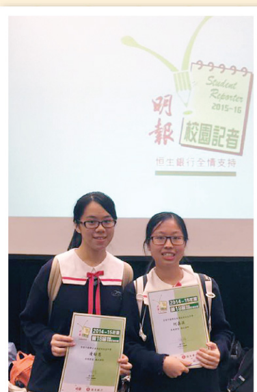
▲ 恭喜兩位明報校園記者畢業！

這個活動教會了我不同的採訪技巧，導師為我們安排各種採訪活動，讓我們實踐所學。他們給予我們互相提問的機會，好讓我們可以知道自己的錯處，從而取長補短。活動中，又邀請了幾位著名的記者和攝影師親自教授我們採訪的技巧。最重要的是，可以令我知道要採訪及報導新聞，單靠一個人是完成不了的。採訪是一個講求團隊合作的活動，隊員之間必須互相提點和鼓勵，才可以完成一個完整的報導。