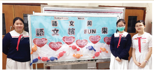
▲ 語文周中、英、普三位司儀。

本年度語文周以「語文續FUN樂」為主題，讓同學透過不同的中、英、普活動，領略學習語文的樂趣。常言道，語文乃源於生活，語文元素俯拾皆是，只要同學多留意、多接觸、多探索，學習語文的園地又怎會囿於課室的圍牆？