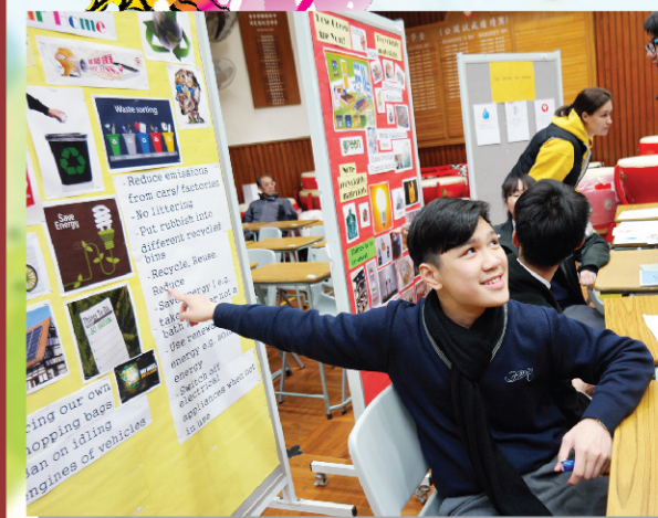
Student ambassador running a game

Learning English isn't only about complicated spelling and grammar rules. Sometimes students may forget this in their struggle to achieve good grades in their exams. They forget that learning can actually be fun! We set out to remind them of this with a week of exciting games, activities and presentations during "Language Week". The English Department ran challenging games like tongue twisters and riddles. Students also loved listening to popular music and watching films. There was a book fair with attractive English texts to purchase. For the Campus TV broadcast, our native-English teachers ventured out into Ma On Shan to interview people on the street about their experiences learning English. The English Wonderland games invited students to think about languages across the world and test their English vocabulary. With such a fun range of activities across the week, students couldn't help but admit that learning English can be fun!