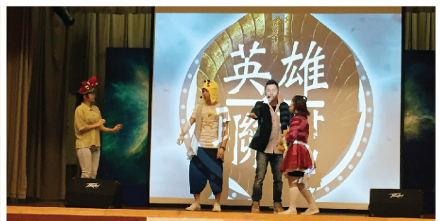
▲《型男宅急便》以輕鬆手法帶出學習語文的樂趣。