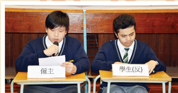
▲ 主持代入不同的身份發表意見。