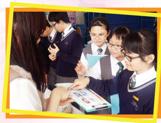
▲ 學生在遊戲中以普通話應對交流。

今年是我第二年擔任普通話大使。比起去年，我現在更加得心應手。中一的時候我對事物十分陌生，不知道如何去與同學交流，如今，我已可大方地向同學介紹關於普通話的遊戲，無意中鍛鍊了我的膽量，使我受益匪淺。