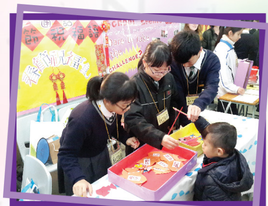
▲ 普通話大使耐心地教導小朋友。

這次擔任工作人員讓我樂在其中，在和玩遊戲的同學互動中，我從中得到不少樂趣，也得到滿足感，因為每個玩遊戲的朋友，都是笑著玩、笑著離開的。