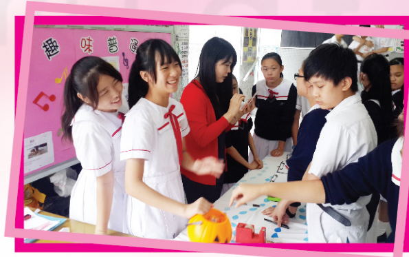
▲ 午間攤位遊戲甚受學生歡迎。