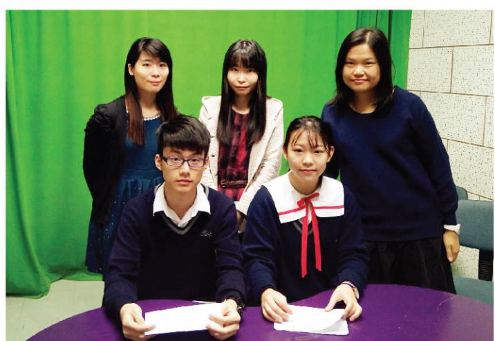
▲ 學生主持與負責老師合照。