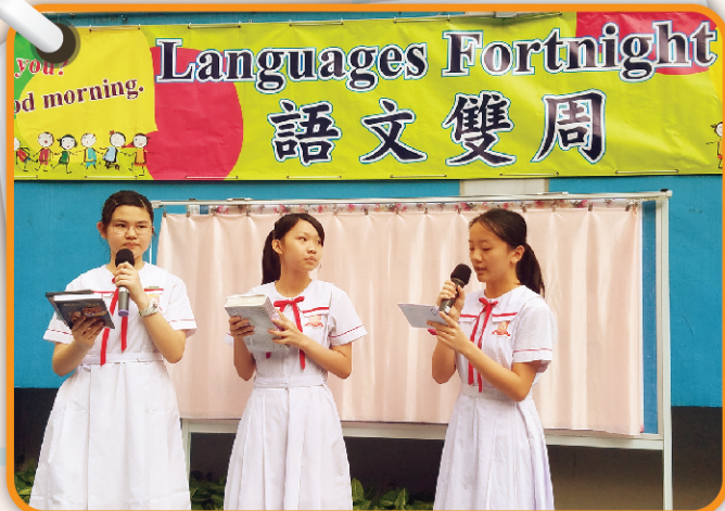
▲ 開幕禮上，三位司儀表現出色，演說流利，盡顯默契。