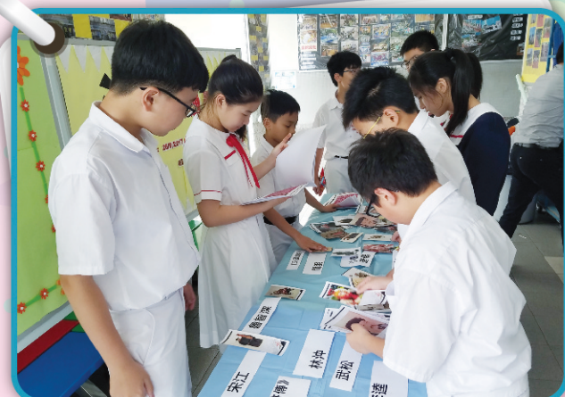
▲ 同學在遊戲中專注投入，期望在攤位遊戲中贏得獎品！