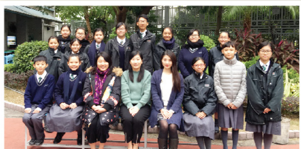
▲ 全體參加中文朗誦比賽的同學與訓練老師合照。

本科每年都會安排學生參加校際朗誦比賽，本年繼續聘請導師為學生提供專業指導。透過朗誦，除了讓學生學會利用聲音傳情達意，還能培養學生體味文學作品的能力和興趣，陶冶性情。本年共有十七位同學參加比賽，超過九成同學的成績達優良或以上，當中更有五位同學脫穎而出，摘下兩冠三季的佳績。