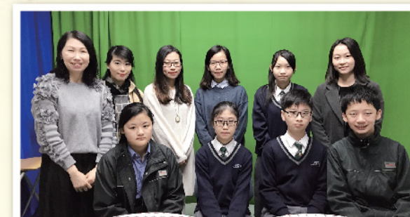
▲ 中二級參賽同學與負責老師留影。

我很欣賞「悅讀馬拉松」，計劃讓我增加閱讀優秀文章的機會。我亦可自訂閱讀的步伐，照顧了我及同學的學習差異。另外，每次閱讀的五篇文章也與教學課程的語文能力相配合，當我們學習議論文時，便閱讀議論文的篇章，這樣亦鞏固了我們的學習。當然，我們最渴望的是奪得計劃的獎品券呢！