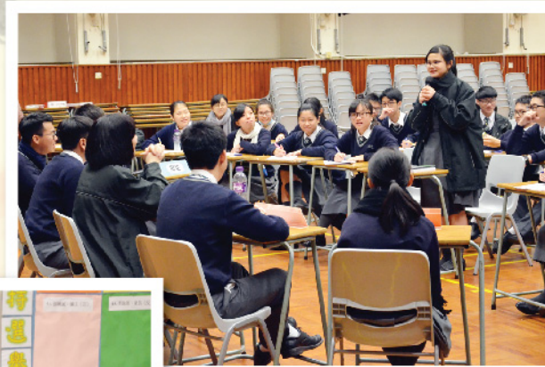
▲ 台上主持與台下觀眾互相砥礪。