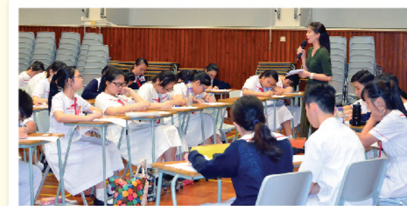
▲ 台下觀眾除了踴躍發言，同時亦認真地摘記要點，非常投入。