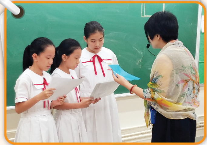
▲ 中一級同學專注地聆聽導師講授朗誦技巧。