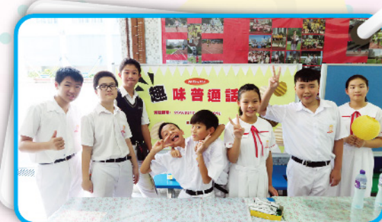
▲ 普通話大使在活動前先來張大合照。

為了增加學生練習普通話的機會，普通話科每月都會舉辦普通話攤位遊戲。活動在午間時段進行，普通話大使會和同學玩玩遊戲，說說普通話，希望同學在遊戲中也能提升普通話的表達能力。每次活動都有不少同學參與，其中以低年級同學更為踴躍。在活動進行之前，普通話大使會在早會時段作宣傳，介紹攤位的主題和遊戲的玩法，這樣，同學玩起來會更有信心。除此之外，我們也會為同學準備精美的禮物，同學在玩遊戲之餘也獲得獎勵，可謂一舉兩得。