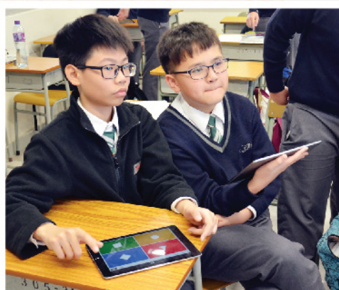
▲ 運用資訊科技教學，課堂變得樂也融融。

為配合本校兩文三語的政策，中文科在初中開設「普教中」課堂以提升學生的語文能力。在課堂上教師以普通話作為教學語言，培養學生之聽、說能力，並且於課堂滲入粵普對譯訓練(包括課堂教授、默書等)，著重書面語之字詞訓練，促進寫作成效，提升學生的寫作能力。本年度「普教中」課堂更運用資訊科技教學，進一步提升課堂互動，增加學生的學習興趣。