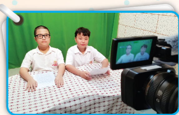
▲ 兩位男生從容地面對鏡頭廣播。

每逢星期二的早會時段，我校都會以普通話進行廣播。來自不同年級的學生主持會以普通話就不同的主題作分享，影片內容則包括溫馨故事、有趣短片及勵志歌曲等。分享過後，主持人還會帶領同學一起複習語音知識。另外，本年度繼續有普通話午間攤位遊戲的簡介環節，除介紹遊戲規則，也會和同學們預演部分題目，務求吸引學生到場玩樂之餘，也能練習普通話，以期同學在日常生活潛移默化，從而提升運用普通話的能力。