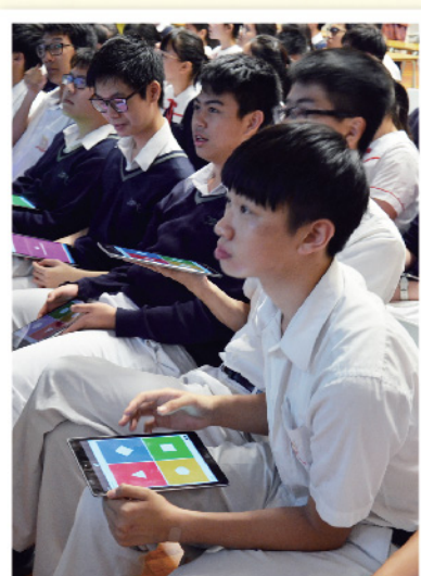
▲ 周會期間，同學使用平板電腦進行問答遊戲。

透過這次活動，我除了更認識金庸小說，如情節鋪排和筆下的人物形象外，在老師的指引下，我對欣賞小說更另有一番新體會！