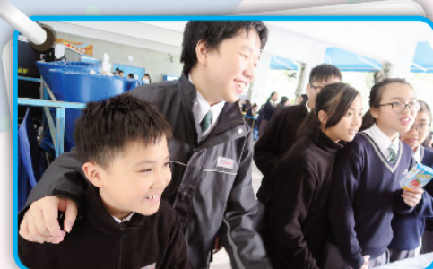
▲ 同學們全情投入地參與遊戲。

我很高興今年擔任普通話大使。還記得第一次負責活動時，我真是有點緊張。當我第一次拿起遊戲卡時，我發現自己有點不知所措，因為有些字不懂得如何讀，所以有點擔心，心想：「我現在是普通話大使，如果連字也讀不準確，真是有點不好意思呢！」但最後我都克服了這心理障礙。後來當有同學按了我的指示完成遊戲後，我也逐漸恢復了信心。看到同學玩遊戲時那開心的樣子，我心裡也很有滿足感。