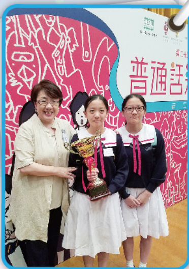
▲ 獲獎同學在頒獎典禮中與評判老師合照。

人生還有多少個「第一次」呢？第一次參加演講比賽就收穫了令人滿意的成績，這是我意想不到的。與朗誦相比，演講的難度似乎更高，動作、眼神、聲線無不影響著最終成績。我抱著第一次參加比賽獲取經驗的心態完成了初賽，對我來說不是一件易事，與朗誦截然不同的風格讓我花了不少心思投入練習。這次比賽我不僅從中獲得了不少經驗，也更深刻地體會到人們常說「努力過後終有回報」的真正含義。