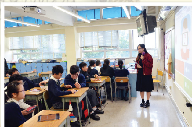
▲ 普教中課堂滲入電子教學，學生學習事半功倍。