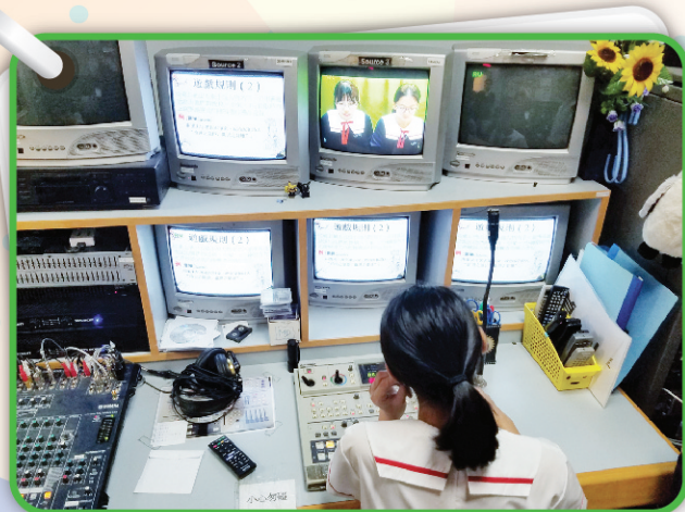
▲ 普通話大使在校園電視台廣播中，介紹語文雙周精彩的活動。

本年度語文雙周的主題是「戲說人生」。在為期兩個星期的活動中，普通話科安排了不少活動，讓同學從趣味中學習。首先，在普通話早會中，主持人配合短片介紹了小說《西遊記》中的人物特徵；午息時段則設有「趣味普通話」攤位遊戲，主題圍繞四大名著，同學既可以在遊戲中感受小說人物的品德情操，也可以練習普通話語音知識，可謂一舉兩得！此外，中三、四級的週會則邀請到「遊劇場」到校演出《歇後嶼山》的普通話劇場，故事情節峰迴路轉，演員表現幽默詼諧，同學自然樂在其中！