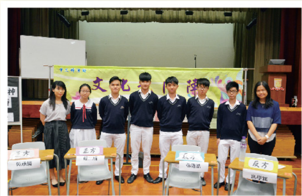
▲ 文化龍門陣活動後來一張大合照。