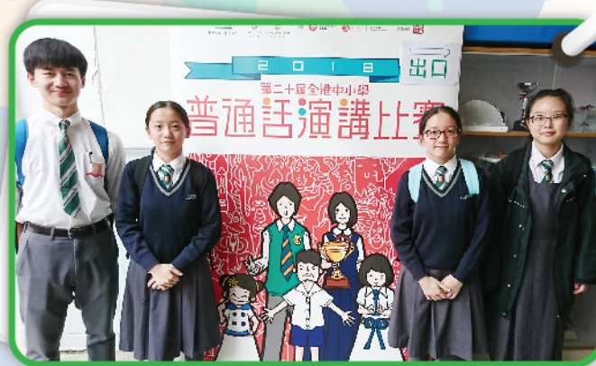
▲ 四位高中同學皆在演講比賽中發揮水準，其中兩位更奪得「優異星獎」，並成功進入複賽。