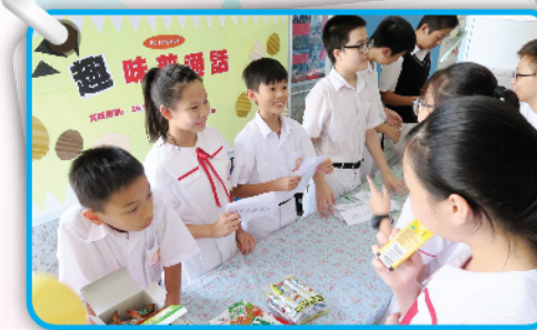
▲ 同學答對問題即有小禮物作獎勵。