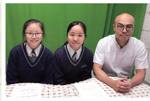
▲ 三、二、一，廣播正式開始！

校園電視廣播已進入第二個年頭。此活動運用校園電視台作為平台，以深入淺出的方式向學生介紹不同的語文及中國文化知識。期望透過多元化的節目內容，提升學生學習中國語文的興趣。本年度的主題為「中國四大」，當中包括「中國四大美人」、「中國四大才子」、「中國四大醜女」及「中國四大名狀」。透過介紹不同人物的生平軼事，提升同學對中國文化及文學的認識。