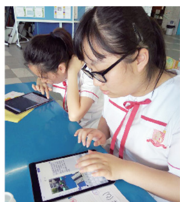
▲ 加插圖片，再運用景物描寫及修辭法來寫作。