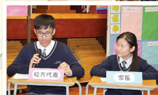
▲ 學生主持代入不同的身份發表意見。