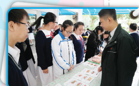
▲ 問題似乎挺有挑戰性呢！