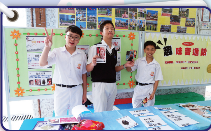
▲ 幾位普通話大使在主持攤位遊戲時皆樂在其中。

劇場剛開始時，出場人物是用粵語和「不鹹不淡」的普通話講對白，雖然聽起來讓我倍感「親切」，但同時令我疑惑這個劇場的演員似乎不太專業。後來我才發現我錯了，原來他們是用一種更特別的方式讓我們了解更多普通話的發音技巧！此外，欣賞劇場時，也讓我明白到原來粵語和普通話的歌後語看似沒有關連，但卻有聯繫，實在令我獲益良多！希望明年也能在學校欣賞更多普通話劇場！