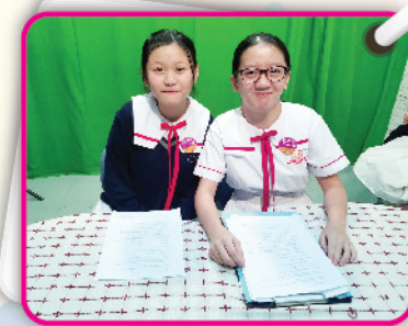
▲ 兩位來自高中的主持經驗豐富，信心十足。