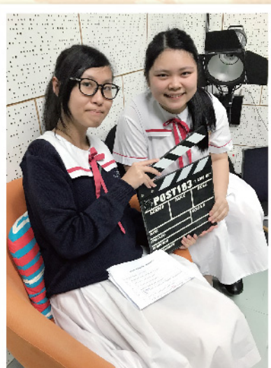
▲ 兩位主持在校園電視台準備就緒，公佈金庸筆下十大武林高手！