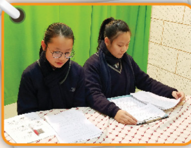
▲ 兩位中一小主持在早會前認真地練習。