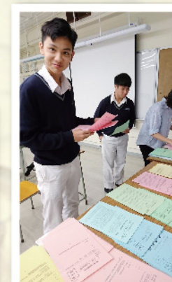
▲ 每次「悅讀馬拉松」均設五個等級的文章，供同學閱讀研習。