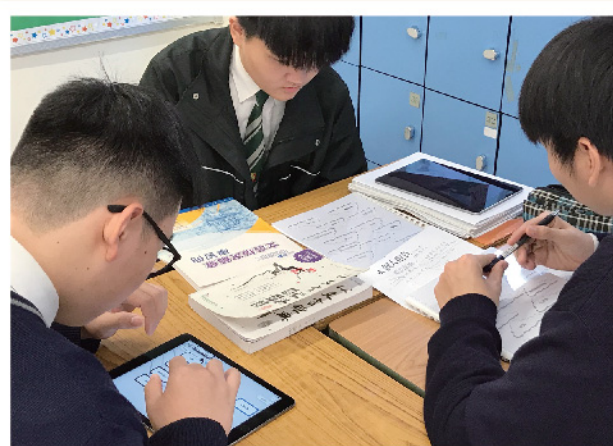
▲ 三人行，必有我師焉！學習除了同窗，還加上平板電腦。