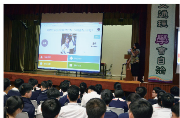
▲ 快來看屏幕，選出正確答案吧！