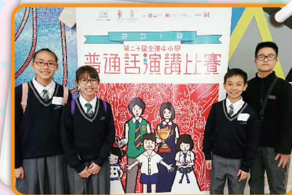
▲ 四位初中同學首次參與演講比賽，表現良好。