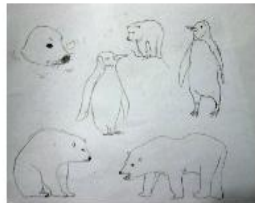
← 嘗試繪畫動物形態 ↓