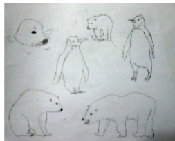
←嘗試繪畫動物的形態 ↓