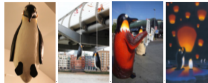
↓ 黃瑞芳作品 ↓

他的作品表示方式創新, 很容易吸引別人注目。他的其中一份經典作品是《上吊死諒的企鵝》, 曾於倫敦千禧橋懸掛著, 意指企鵝受到全球暖化的影響上吊自殺, 生不如死, 明顯帶出了生態系統問題。他的作品裏都喜愛以企鵝作為主角, 因為黃瑞芳認為企鵝是一個最能代表生態的動物。他的裝置藝術作品很多是用來警告世暖化危機。 ↓