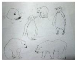
←嘗試繪畫動物作主角 ↓