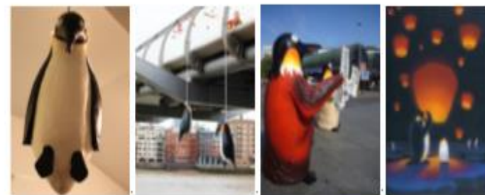
↓ 黃瑞芳作品 ↓

他的作品表示方式創新, 很容易吸引別人注目。他的其中一份經典作品是《上吊死諫的企鵝》, 曾於倫敦千禧橋懸掛著, 意指企鵝受到全球暖化的影響上吊自殺, 生不如死, 明顯帶出了生態系統問題。他的作品裏都喜愛以企鵝作為主角, 因為黃瑞芳認為鵝是一個最能代表生態的動物。他的裝置藝術作品很多是用來警告世暖化危機。 ↓